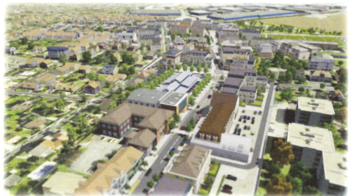
Voici une vue d'une simulation du futur écoquartier depuis l'avenue du Maréchal Leclerc

La CCU accompagne et gère aujourd'hui de nombreux projets urbains, en collaboration avec les élus locaux et la population. On peut citer les quartiers Pasteur et des Temps durables de Limeil-Brévannes, le quartier Nogent-Baltard à Nogent, le quartier des plaines champs à Louveciennes, le quartier Descartes-Blériot à Calais.