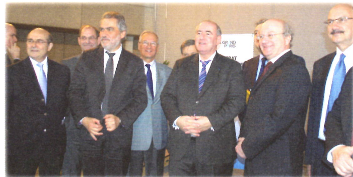
Les signataires du CDT des Boucles de la Marne en présence de Maurice Leroy, Ministre de la ville.