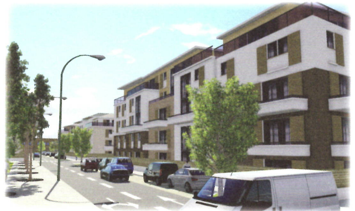
Les simulations permettent d'imaginer différentes ambiances et typologies de logements.

Aujourd'hui, Chennevières manque de logements accessibles (appartements ou maisons individuelles). Il est de la responsabilité de la ville d'offrir des opportunités nouvelles de logements, notamment pour les enfants de Canavérois. Concernant les logements sociaux, la ville de Chennevières a toujours été respectueuse de la loi imposant à chaque commune d'avoir au moins 20% de logement social sur son territoire. Les logements sociaux seront construits à hauteur des nécessités légales, avec des possibilités d'accession à la propriété.