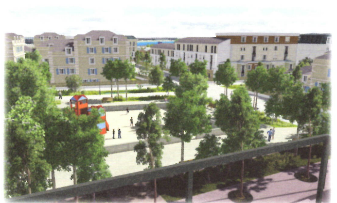
Le parc central vu d'une fenêtre

La prise en compte des problématiques écologiques sont intégrées systématiquement au projet Chennevières Ecocentre. Dans cette perspective, la ville répond aujourd'hui à un concours de l'Agence de l'Environnement et de la Maitrise de l'Energie (ADEME) pour consolider et donner toute la légitimité nécessaire au projet d'écoquartier.