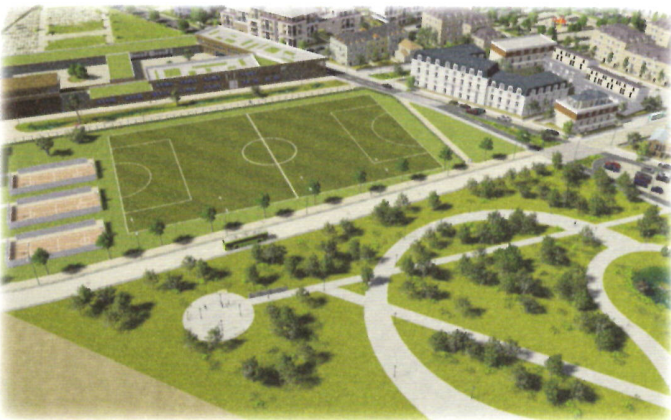
Vue aérienne d'une simulation du grand jardin public avec en fond l'espace sportif ainsi que le groupe scolaire, la crèche et l'espace municipal et associatif

Le projet valorise la création d'équipements nouveaux qui seront dimensionnés pour toute la population canavéroise actuelle et à venir. Les équipements à l'étude sont: un groupe scolaire, une crèche, un centre sportif en remplacement du stade Aristide Briand, un lieu festif (marché, manifestations), des nouveaux espaces de stationnement en sous-sol et RDC (multipliant par deux la surface de parking en centre-ville.)