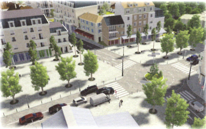
Vue prise de la halle avec en rez-de-chaussée des immeubles, des commerces principalement alimentaires

Pour que les commerces de proximité s'installent en coeur de ville, ils doivent avoir la certitude d'avoir une zone de chalandise dense.