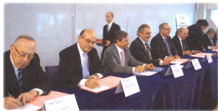
Signature de l'accord cadre du CDT des Boucles de la Marne entre tous les acteurs institutionnels territoriaux le mercredi 21 mars 2012.