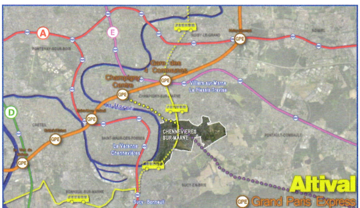
Connexions TCSP Altival aux deux gares du Grand Paris Express