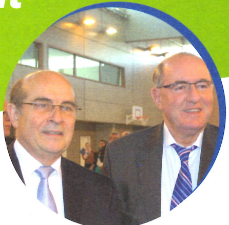
Bernard Haemmerlé, Maire de Chennevières et Maurice Leroy, Ministre de la ville, lors de la signature de l'accord cadre du CDT des Boucles de la Marne le 21 mars dernier.